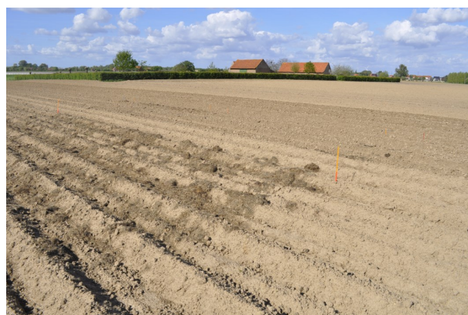
Foto: Grasklaver als mulch toegediend.

In het begin van de teelt tekenen zich enkele duidelijke verschillen af in gewasstand (Tabel 5). De nulbemesting en oppervlakkig bemesten van maaimeststoffen hebben op 09/06 de minste gewasstand. Op 22/07 komt enkel het onbemeste perceel nog achter op de rest. Op het einde van het groeiseizoen is dit verschil niet meer te merken. Alle objecten zijn op dat moment in afrijpingsfase. De bemeste objecten tonen