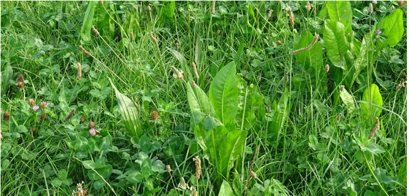
Foto 2: Een evenwichtige samenstelling van grassen, kruiden en vlinderbloemigen lijkt een stabiliserende invloed op de voederwaarde te hebben doorheen het jaar