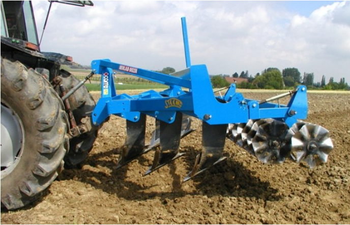
Figuur 2: Diepwoeler van het type 'Dent Michel' in combinatie met schijven

Hierdoor wordt het onkruid en de achtergebleven resten van groenbemesters uit de plantenrij geduwd. Wanneer eerder aanaardend geschoffeld wordt, worden de votten in de rij geduwd en worden de kleine plantjes verdrukt.