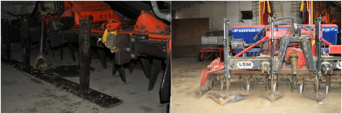
Figuur 1: Volvelds mes of brede ganzevoeten in combinatie met rotoeg om groenbemester te vernietigen

Het verdient de voorkeur een groenbemester te kiezen die doodvriest tijdens de winter. Groenbemers die veel massa hebben gevormd of die niet volledig zijn doodgevroren kunnen dan eenvoudig met een klepelmaaier vernietigd worden. Enkele voorbeelden van groenbemers waar reeds goede resultaten worden mee gehaald zijn phacelia, haver en bladrammenas. Ter vervanging van een éénjarige grasklaver werden reeds goede resultaten gehaald met een combinatie gerst met wikke. Deze levert een gelijkaardige hoeveelheid stikstof en zorgt tevens voor een goede bodemstructuur. De gerst-wikke combinatie wordt in dat geval ingezaaid in het voorjaar en geklepelmaaid wanneer het graan in aar komt.