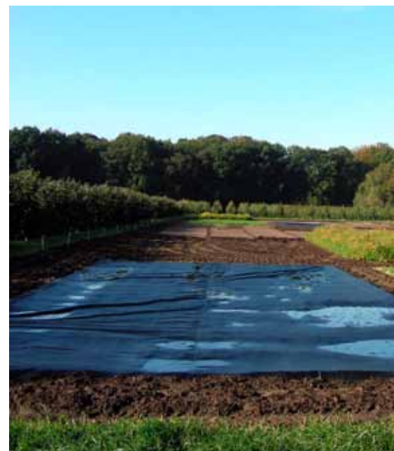
Verschillende methoden zijn mogelijk voor bodemontsmetting.

Een ander belangrijk aspect is de bodemstructuur. Hieraan wordt in de praktijk op dit ogenblik te weinig aandacht besteed. Het enige tijdstip waarop er iets grondig kan worden veranderd is net voor het planten. In bestaande aanplanten is het niet mogelijk om organisch materiaal onder te werken voor een betere bodemstructuur en vochtbehouding. Het grote probleem van bodemmoehed is dat de symptomen zich pas manifesteren wan-