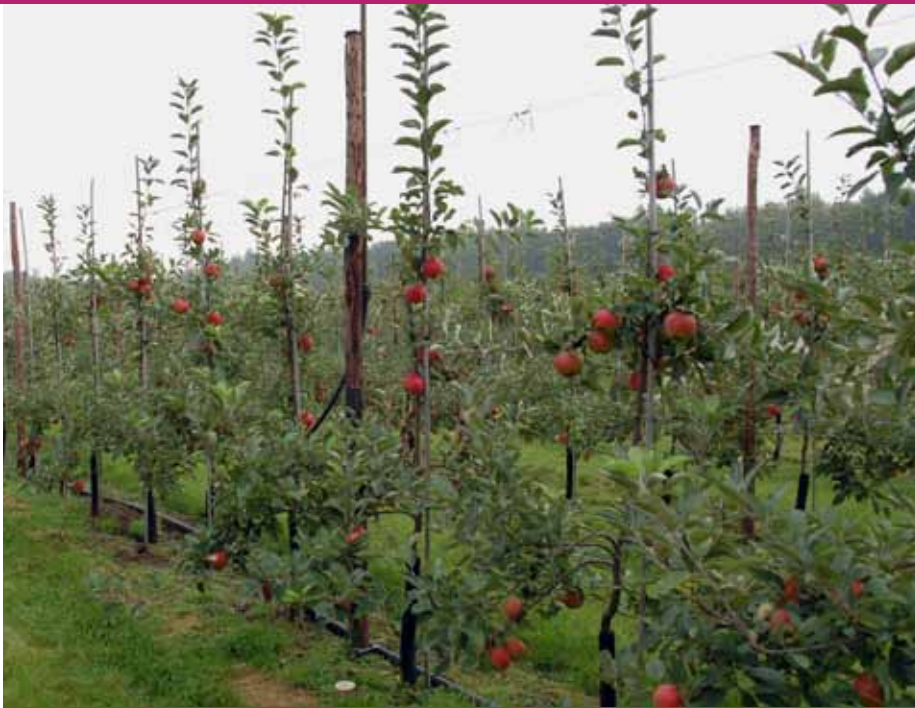
Bodembehandeling met Tagetes geeft goede groei.