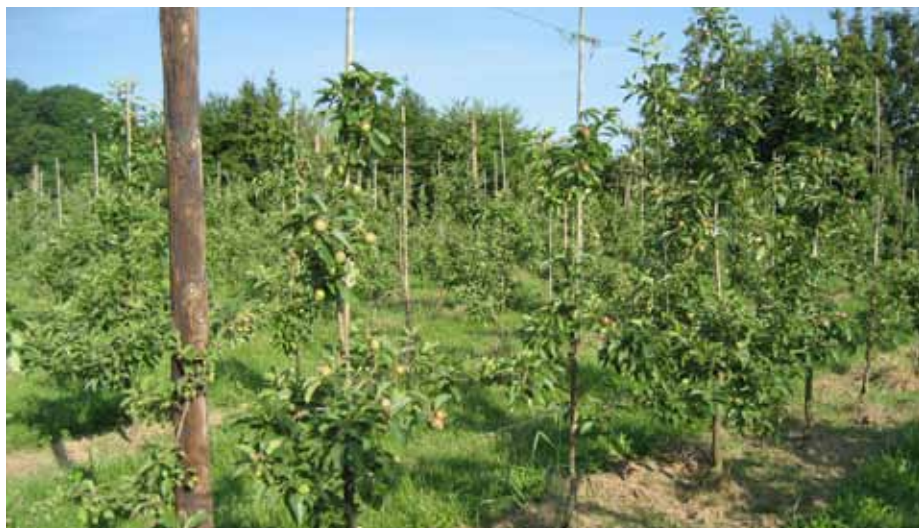
Bodemmoeheid in Topaz aanplant.

Land- en tuinbouwbedrijven zijn zich de laatste decennia sterk gaan specialiseren. Door die specialisatie ligt teeltrotatie niet langer meer binnen de mogelijkheden. Hierdoor nemen de problemen met bodemmoeheid sterk toe. De herinplant in de fruitteelt is alleen mogelijk als de bodemmoeheid wordt aangepakt. Alternatieve methoden van grondontsmetting waren tot nu toe in de meeste gevallen minder effectief of in vergelijking met chemische grondontsmetting veel duurder.