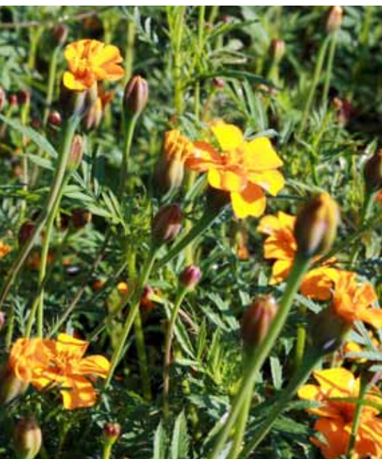
Tagetes patula (Afrikaantjes).

neer de bomen reeds zijn geplant. Omdat fruitteelt een meerjarige teelt is, is dit nog moeilijk op te lossen. Bovendien is het binnen de biologische teelt nog veel moeilijker om hier iets aan te doen. Toch is dat wel noodzakelijk, want een slecht groeiende aanplant zorgt voor een groot financieel verlies voor de teler.