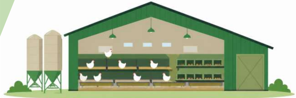
Alles manueel = intensief