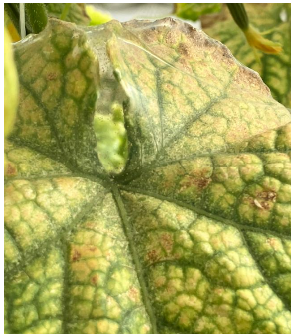
Foto 4: Schade door spint op komkommer met zichtbare webvorming op de bladeren.

In 2025 zorgde de kasspintmijt voor schade in komkommer en aubergine. De hoge temperatuur en lage luchtvochtigheid in juli zorgde voor een snelle voortplanting van deze plaag in tunnels en kassen. De aantasting nam nog toe in augustus. Dit leidde tot aanzienlijk kwaliteitsverlies van de vruchten. In 2024 zagen we slechts op één locatie aantasting door spint op aubergine en dit pas laat op het seizoen.