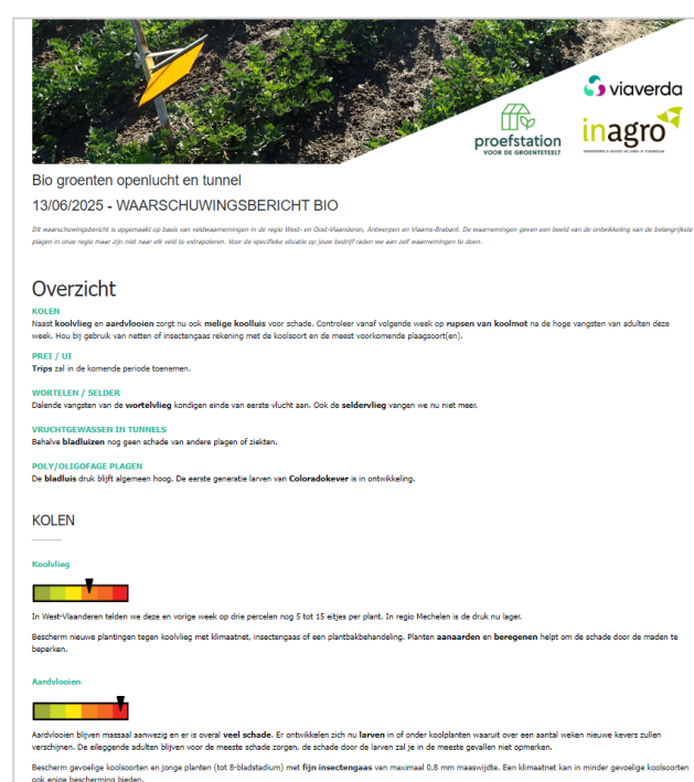
Figuur 1: Waarschuwingbericht voor biogroenten

Biotelers met vruchtgroenten onder beschutting kunnen beroep doen op teeltadvies door Viaverda. Maar een waarschuwingssysteem met structurele opvolging van plagen was er voor deze sector nog niet. Bovendien hebben veel korteketenbedrijven ook teelten in tunnel of serre. Een uitbreiding van de waarschuwingen met vruchtgewassen biedt zo een meerwaarde voor de hele bio groentesector.