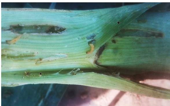
Foto 3: Rupsen van preimot, soms meerdere per plant, kunnen zich tot diep in prei schacht boren.

Ook preimot toont slechts lokaal hogere vangsten in juni en september. In 2024 zagen we weinig schade door de rupsen. In 2025 zagen we opmerkelijk veel schade in prei die eind september of begin oktober geoogst werd. De inwendige vraatgangen waren pas zichtbaar bij het pellen.