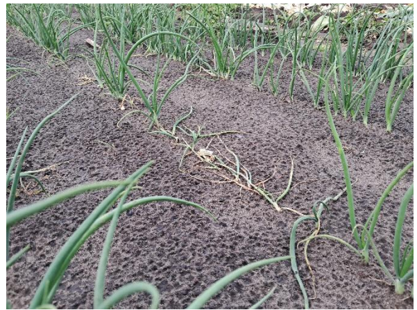
Foto 2: Preivlieg kan zorgen voor wegval van gezaaide prei en ui na opkomst.

Zowel bonen- als uienvlieg (synoniem: preivlieg) kunnen schade veroorzaken in gezaaide teelten prei en ui. De schadebeelden lijken sterk op elkaar, al tast bonenvlieg vooral zaden aan (voor opkomst), terwijl uienvlieg eerder jonge (kiem)planten aantast (na opkomst). Beide plagen kunnen we monitoren met blauwe vangplaten. In 2024 nam PSKW vanaf half april bonenvliegen waar. Op het proefbedrijf bij Inagro was er schade door de maden bij opkomst van lupinen, uien en spinazie.