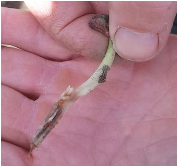
Foto 1: Schadebeeld door bonenvlieg aan een kiemplant op 29 april 2024.

In tunnels was er aantasting door Mycosphaerella en valse meeldauw in komkommer en in tomaten trad Phytophthora en Botrytis meer op tegen het einde van het seizoen. In openluchtgroenten tekende seizoen 2024 zich door een hoge druk van Septoria bladplekken in selder en van Alternaria in koolgewassen.