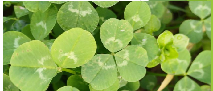
Cultuurras (groeit iets hoger, loopt minder uit)