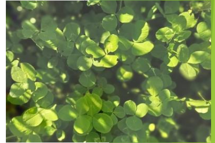
Weideras (blijft iets lager, loopt meer uit)