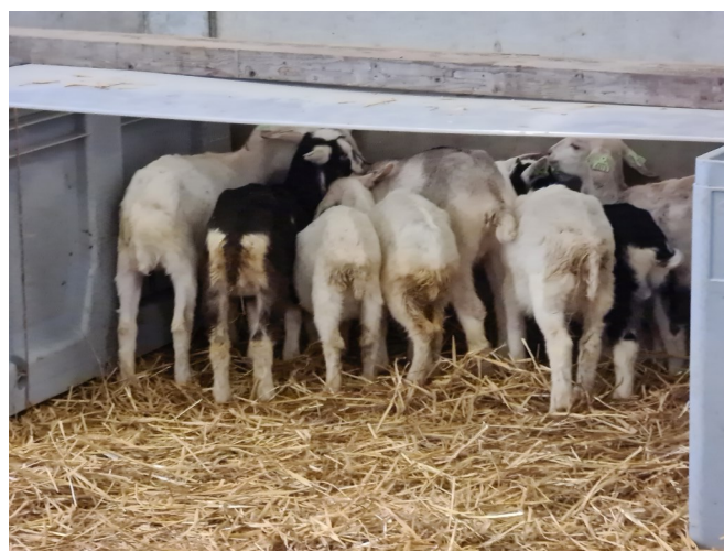
Foto 3: Bevuiling van de achterhand en verkrampte lichaamshouding bij de miekes die gevoed werden met verpoederde geiten- en koemelk.

In het geval van een langere opfok ter compensatie bedraagt het margeverlies nog maar 1,5 euro per 100 liter melk, oftewel 1,6% in de omzet bij de droge geitenmelk.