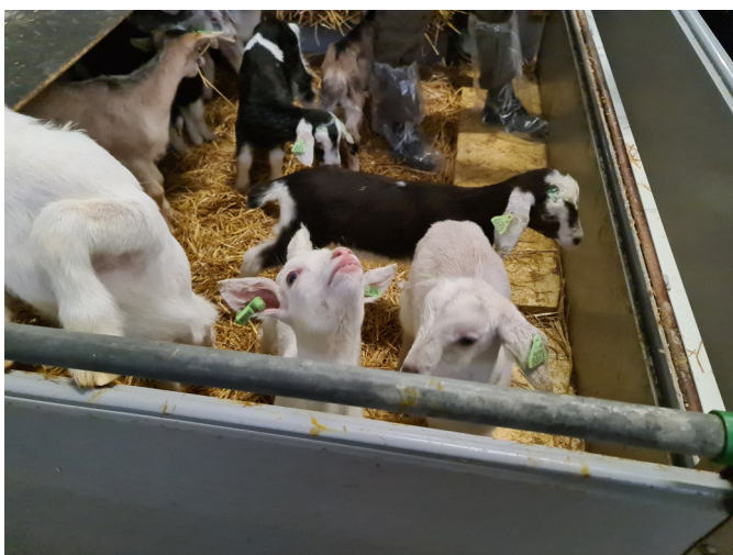
Foto 2: Van zodra de lammeren vlot zelf melk opnemen worden ze overgeplaatst naar ruimere groepsboxen.