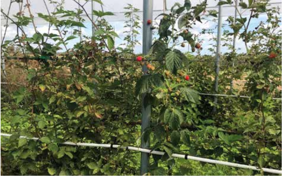
Gemengde intercropping waarbij frambozen en bramen elkaar afwisselen in de rij

worden nu geanalyseerd aan de KULeuven om de genetische karakterisatie te maken. Voor spint zijn ook de eerste stalen verzameld in 2020 en wordt de DNA extractie opgestart. Luizen waren niet talrijk aanwezig waardoor er nog geen conclusies kunnen gemaakt worden. Het eerste proefopzet met de Europese vogelkers in het proefperceel gaf niet de verwachte resultaten. Rondom de Europese vogelkers was er geen lagere aantasting van D. suzukii alsook waren er geen eieren van D. suzukii te vinden in de bessen van de Europese vogelkers. Dit wordt volgend jaar opnieuw herhaald.