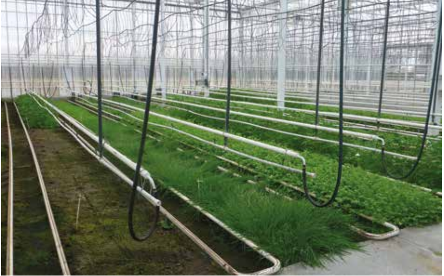
Serre in de winter ingezaaid met verschillende vanggewassen

De praktische haalbaarheid van het onderzaaien/onderplanten van verschillende gewassen werd geëvalueerd bij een hoofdteelt paprika. Belangrijk is om bij een tussenteelt in het achterhoofd te houden dat de vochtigheid in de buurt van de stengel niet te hoog mag oplopen want dit geeft aanleiding tot schimmelziektes zoals Sclerotinia . Het inzaaien of tussenplanten van de verschillende soorten tussenteelten had geen invloed op de productiecijfers van de paprika's.