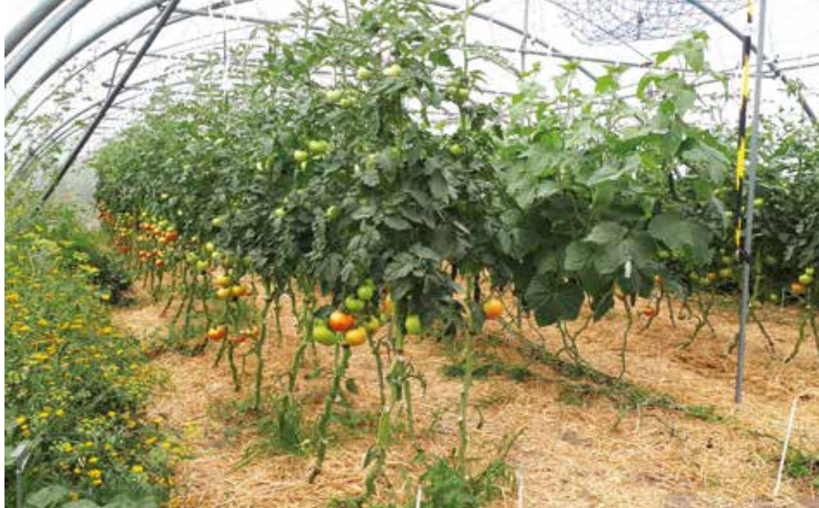
Innovatief teeltsysteem in België tijdens de zomer: menging van tomaat en komkommer, stro als natuurlijke mulch en bloemenranden om natuurlijke vijanden aan te trekken