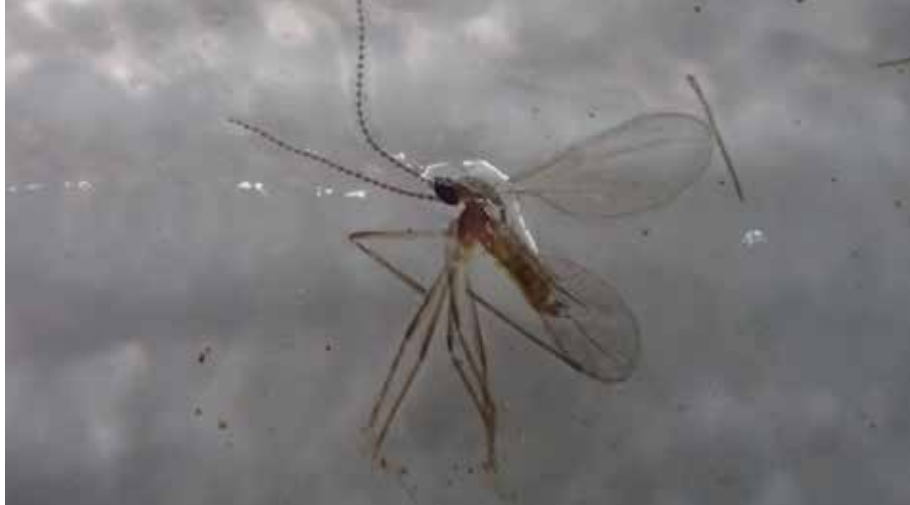
Een koolgalmug op een vangplaat van een feromononval