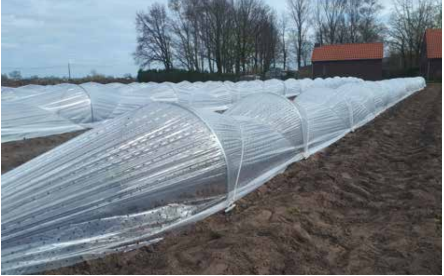
Minitunnel met ijzeren bogen en gaatjesfolie als afdek materiaal