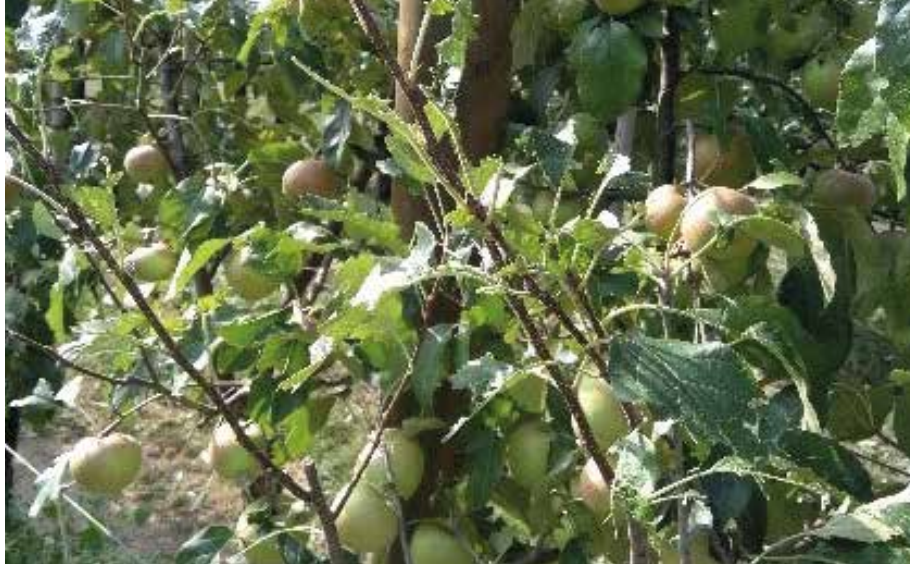
Bladblazen bij 'Natyra®'