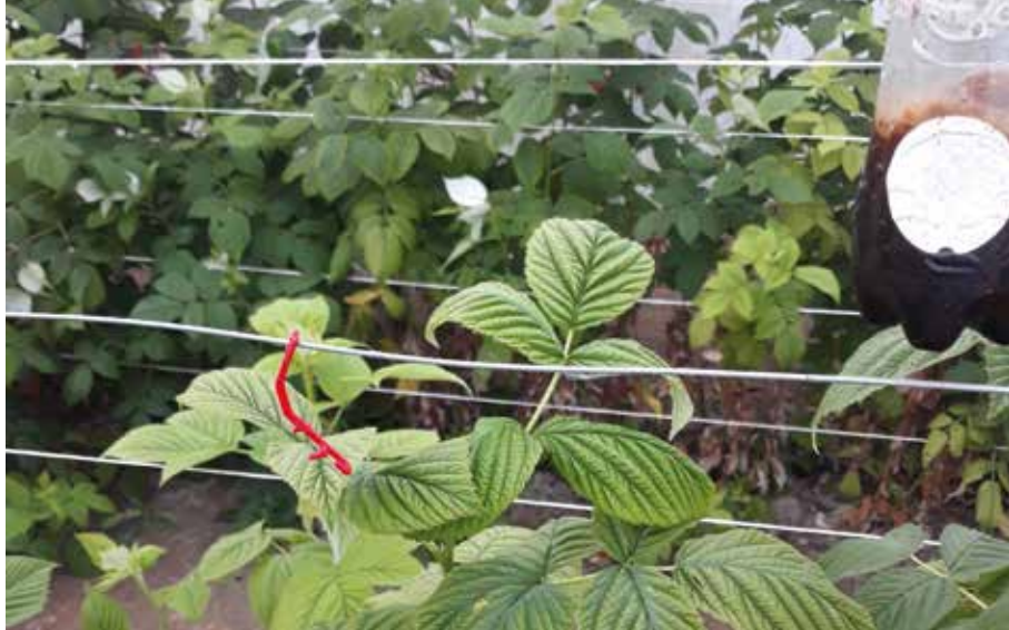
Geelverkleuring van de bladeren bij herfstframboos

plaatje dat er bij een tekort best zo snel mogelijk wordt ingegrepen om de plantengroei zo min mogelijk te verstoren. En dat fractioneren mogelijks een effect kan hebben op herfstframbozen, maar dan enkel en alleen wanneer er in de plant geen grote tekorten voorkomen.