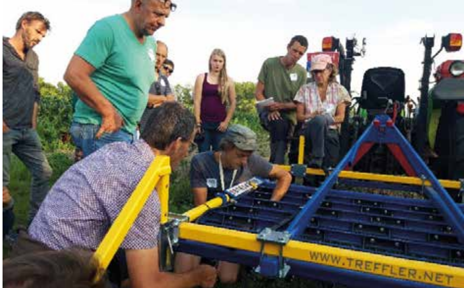
Telers verzamelen rond een kleine versie van de Treffler-wiedeg, op maat van de kleinschalige groenteteelt

worden toegepast in de groenteteelt. Een effectief, breed inzetbaar, goedkoop en redelijk eenvoudig zelf te maken toestel om wortelonkruiden mee te lijf te gaan is de 'Rod weeder'.