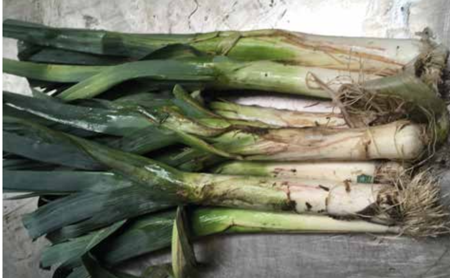
Schadebeeld van geogoste winterprei: de vaatgangen verkleuren roodbruin en soms kan je kleine bruine popjes waarnemen