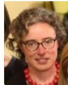
An Gomand, proeftuin pitfruit