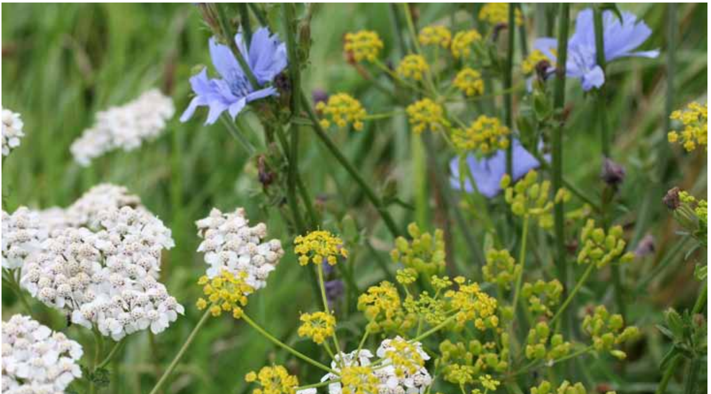
Hoogte van mineralengehalte van kruiden hangt af van: soort kruid, grondsoort, gebruik van stengel of blad en aandeel kruiden in rantsoen.

Bij gras en witte klaver wordt de minerale samenstelling mede bepaald door de grondsoort. Uit Vlaams onderzoek blijkt echter dat er geen direct verband bestaat tussen het mineralengehalte in de bodem (laag 0-10 cm) en in de kruiden geteeld op deze grond. Alleen voor het fosforgehalte werd een positieve relatie gevonden tussen de bodemtoestand en het fosforgehalte in de kruiden. Mogelijk speelt de diepere beworteling van kruiden hier een rol, waardoor de bodemtoestand in de laag 0-10 cm minder bepalend is. In het algemeen wordt een lager mineralengehalte vastgesteld in kruiden op een