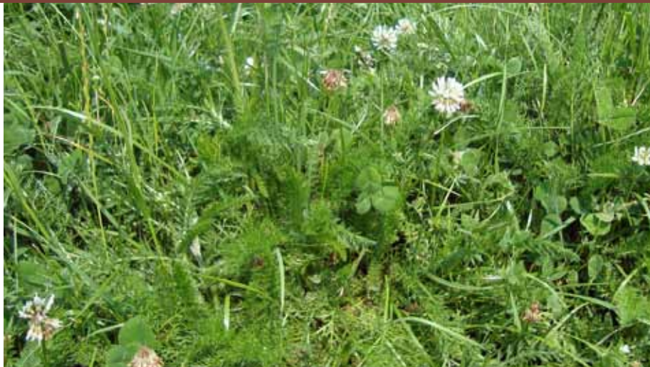
Verbeteren van de mineralenvoorziening met kruiden betekent veel kruiden in de wei.

Uit de simulaties op de vorige bladzijde blijkt dat kruiden een bijdrage kunnen leveren aan de mineralenvoorziening van melkvee. Vraag blijft wel wat de werkelijke benutting is van mineralen uit kruiden door het dier.