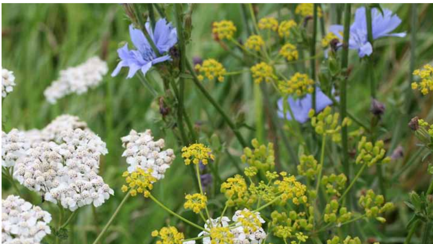
Hoogte van mineralengehalte van kruiden hangt af van: soort kruid, grondsoort, gebruik van stengel of blad en aandeel kruiden in rantsoen.

Bij gras en witte klaver wordt de minerale samenstelling mede bepaald door de grondsoort. Uit Vlaams onderzoek blijkt echter dat er geen direct verband bestaat tussen het mineralengehalte in de bodem (laag 0-10 cm) en in de kruiden geteeld op deze grond. Alleen voor het fosforgehalte werd een positieve relatie gevonden tussen de bodemtoestand en het fosforgehalte in de kruiden. Mogelijk speelt de diepere beworteling van kruiden hier een rol, waardoor de bodemtoestand in de laag 0-10 cm minder bepalend is. In het algemeen wordt een lager mineralengehalte vastgesteld in kruiden op een