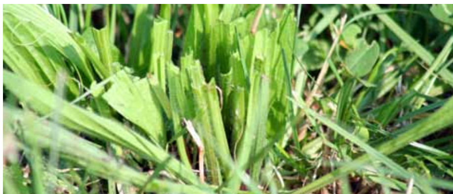
Hoeveelheid mineralen wisselt per snede.

kleibodem dan in kruiden op zand. Het lager gehalte mineralen in kruiden op klei is wellicht het gevolg van de sterkere binding van mineralen op het bodemklei-complex, waardoor deze mineralen minder beschikbaar zijn voor opname door kruiden.