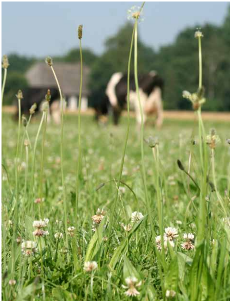
Biodiversiteit in de wei geeft een uitgebalanceerder rantsoen in de wei.

Op het moment wordt er een onderzoek uitgevoerd door de Universiteit van Gent in samenwerking met Wim Govaerts & Co, naar de opneembaarheid van mineralen op dierniveau. Uit de voorlopige resultaten komt naar voren dat juist selenium bijna het enige element is, waarbij er een goede correlatie is tussen selenium in het voer en selenium in het bloed. De voorlopige conclusies zijn dat er mogelijk interacties optreden die de beschikbaarheid van de mineralen beïnvloeden. Uit het lopende onderzoek zijn voorlopig nog geen duidelijke voederkenmerken naar voor gekomen die de biologische beschikbaarheid van mineralen beïnvloeden. Wel worden er momenteel in-vitro proeven gedaan rond een aantal mogelijke interacties. Voor een efficiënte inzet van kruiden voor de mineralenvoorziening moeten de verschillen in benutbaarheid verklaard worden.