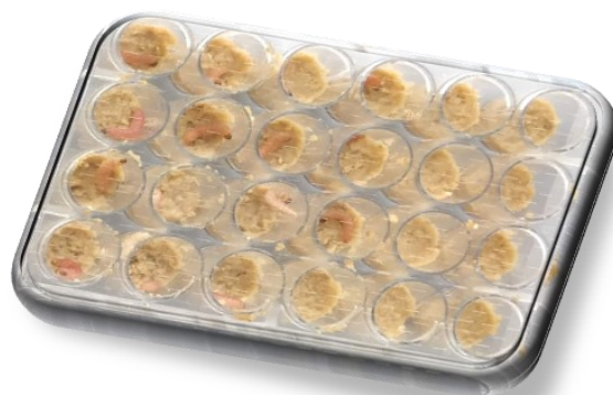
Foto 2: Laboratoriumproef met fruitmotrupsen in 24-well plaat

is. Wel bleek uit de laboproeven de grote impact van de timing van toepassing of de stadiumspecificiteit van de viruspreparaten. Een voldoende vroege toepassing (best op eieren/ontluikende eieren) is cruciaal voor een goede werking.