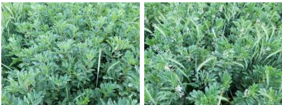
Figuur 2: Scuro (links) en Tundra (rechts) op 19 mei 2022

Wanneer de veldbonen halverwege mei (19/05) in volle bloei stonden hadden Alice en Augusta de andere rassen al terug ingehaald. Scuro bleef wel het meest vigoreuze gewas. Algemeen waren alle rassen op dat moment goed gezond. Symptomen van pathogenen (botrytis, roest, ...) waren grotendeels afwezig en er was ook geen schade van bladrandkever, een veelvoorkomende plaag in veldboon.