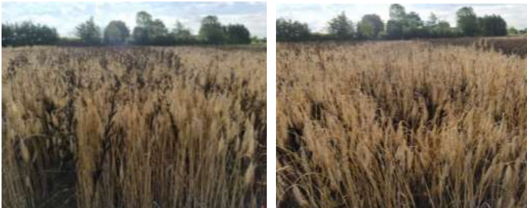
Figuur 3: Augusta (links) is vigoreuzer en duidelijker te onderscheiden tussen het graan dan Scuro (rechts) op 25 juli net voor oogsten.

De veldbonen profiteerden o.a. van de groeizame lente waardoor de rassen dit jaar gemiddeld 10 cm langer uitgroeiden dan vorig jaar. Met gemiddeld 1m47 torenden de langste rassen GL Alice en Augusta boven het graan uit dat gemiddeld 1m30 werd (voet tot top van de aar). Het ras Tundra bereikte gemiddeld 1m35. De kleinste rassen Nebraska, Gl Arabella en Scuro werden uiteindelijk even lang als het graan.