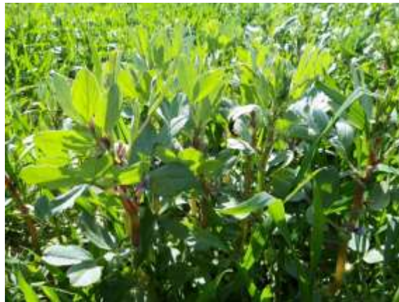
Figuur 1: de rood gepigmenteerde stengels van het ras Scuro

De triticale kende met gemiddeld 55% een slechte opkomst. Mogelijk lag een combinatie van verminderde kiemkracht, diep zaaien (compromis veldboon/graan) en een korte periode met regen net na zaaien aan de basis hiervan. De opkomst van de veldbonen was daarentegen met gemiddeld 83% goed. Enkel het ras Augusta kende met 60% een mindere opkomst. In het begin van de lente (13/04) was Scuro reeds het langst gegroeid en het meest ontwikkeld (meeste bloei). Dit ras was ook gemakkelijk te herkennen aan zijn rood gepigmenteerde stengels terwijl deze van de andere rassen eerder groen waren. De rassen GL Alice en Augusta kenden een tragere jeugdgroei.